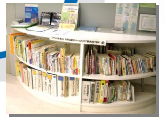
市民活動スペース図書コーナーです。