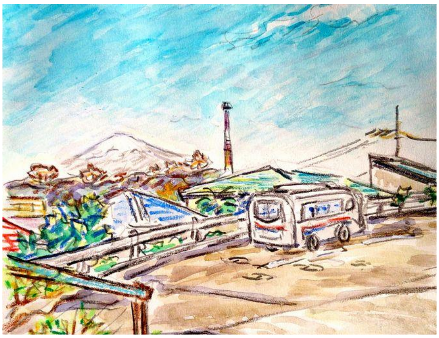
「ミニバスが巡回する街」