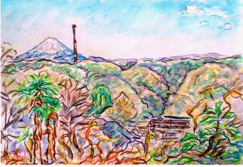
「富士、丹沢、池子原生林、京急電車が走ります。」

逗子は、海と丘の街。すばらしい海と、美しい丘の街。逗子の池子の丘。アザリエは、ここら優しい人々が、憩う街です。