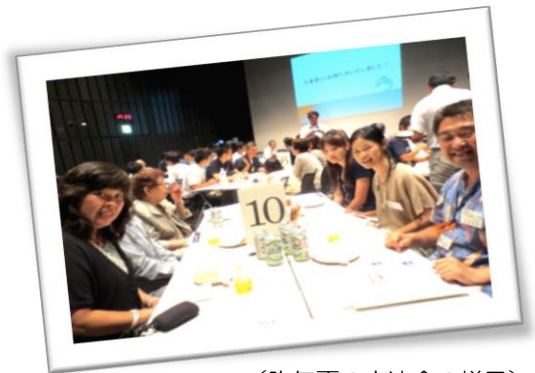
(昨年夏の交流会の様子)