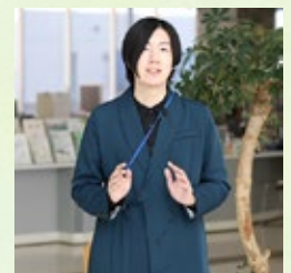
筆者近影 どちらの写真が見やすいでしょうか