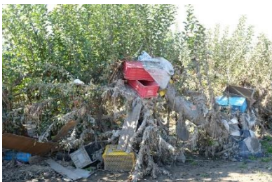
りんごの木に絡みつく災害ゴミ

行政、自衛隊、社会福祉協議会、NPO など、様々な主体が被災地支援のために活動します。それぞれに得意な分野があるのですが、逆に苦手な分野もあるのも事実です。被災者のことを第一に考え、どのような主体が、どのように支援に関わるのか、また互いに協力できるのかを調整したり、支援に必要な情報を共有したりすることが大切になります。中間支援組織(市民交流センターのような施設)は、日頃から地域のハブとして機能している特性を生かして、そのような役割を果たしていく必要があるのではないかと感じました。