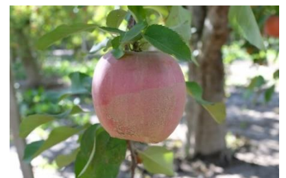
収穫を間近に控えたりんごが被害に