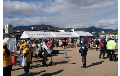
長野市内に開設された災害ボランティアセンターのサテライト

11月8日(金)から11日(月)にかけて、日本 NPO センターからのスタッフ派遣要請を受け、現地の長野 NPO センターの支援のために長野市内にある長野県庁西庁舎災害対策本部にて被災地支援活動を行いました。