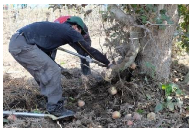
泥が堆積したりんご畑