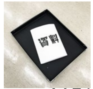
資料が簡単に 出来る！

☆印刷機の利用のみ有料です。参考：製版1回につき500枚まで100円。501～1000枚は150円。