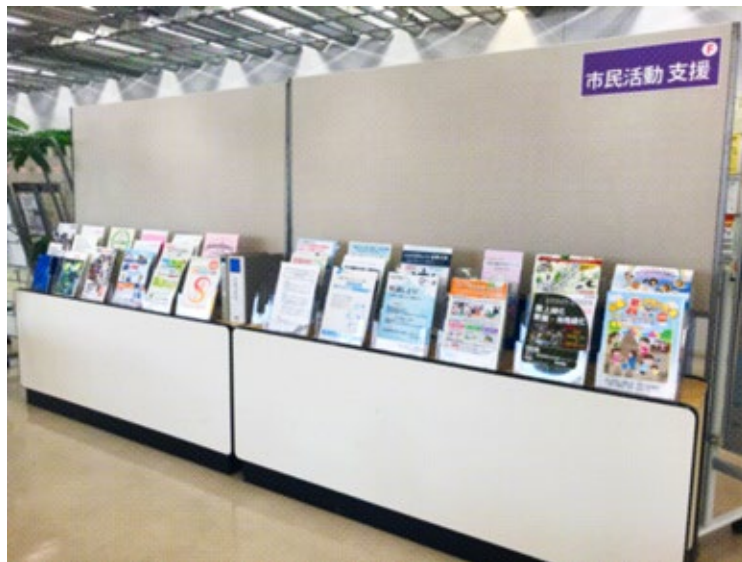
パーテーションはスタッフが丸2日かけて張り替えました

まだまだ配架している情報数は少ないですが、いずれはもっと痒い所に手が届く様な、 活動にとって有益な「出会い」が生まれる様な、そんな情報の交差点にする事が出来たらいいなと考えています。