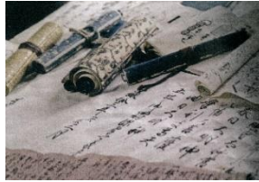
忍者終了の証『巻き物づくり』 by 志士塾