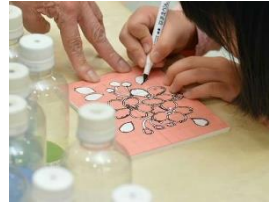
『砂絵ワークショップ』 by 砂絵工房 Js (23日・24日)