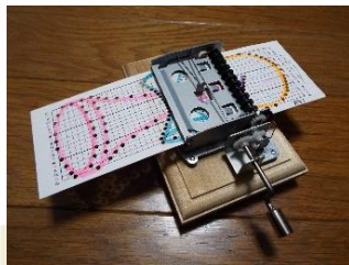
『オルゴールを鳴らすカード作り』 by 川瀬 登