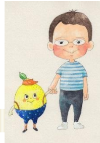
絵本『しろさんのレモネード屋さん』 原画展&ユニバーサルデザインおもちゃ展 (23日・24日)