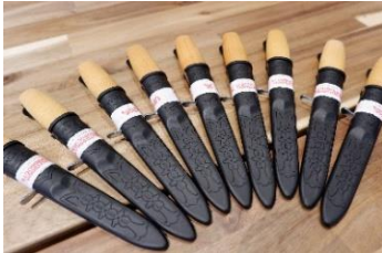
いま、子どもと学びたいアウトドアスキル 『ナイフ&ロープワークショップ』 by UPI OUTDOOR 鎌倉