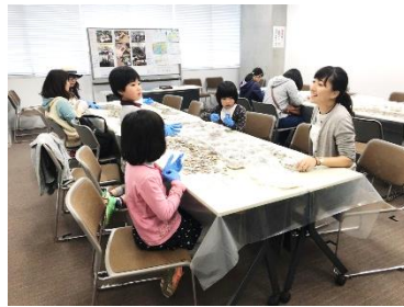
外国のコインを分けてみよう！