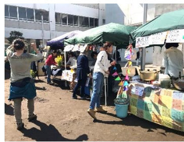
美味しいごはんが待ってるよ♪