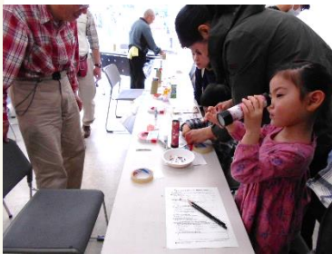
万華鏡づくりに挑戦！

毎年テーマを決めてそのテーマに沿った内容で参加団体を募り、様々なワークショップなどの活動を、来場する皆さんと一緒に体験して学び合う、、、そしてワークショップで体や頭や心を動かした後は、フェスティバルパークへGO！逗子で人気の飲食店が皆さんのお腹を満たしてくれます。お腹もいっぱいになったら今度はステージイベントで盛り上がる！そんな盛りだくさんな内容で楽しむ2日間のイベントなのです。