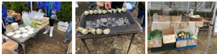
サザエ小屋 × 食の野望

日時 2018年11月24日(土) 10:00~17:00 場所 市民交流センター会議室、フェスティバルパーク 内容 ●講演 「逗子の放課後を考える」講師 中山勇魚氏 ●放課後支援団体の活動紹介展&交流サロン ●市民活動団体によるパネル展 ●Atelier fuqu の誰でもアート ●逗子市民石けんづくり ●同時開催：サザエ小屋・食の野望