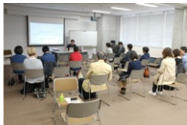
講演「逗子の放課後を考える」