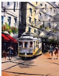
鎌倉水彩画塾 ギャラリーより