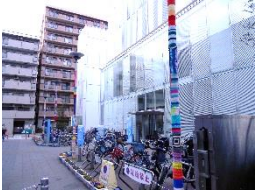
逗子ヤーンボンパーズ