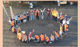
オレンジフェスの様子

パークにて実施し、約 320 人の来場があった。認知症、健康づくりにちなんだクイズ形式のスタンプラリーや、認知症サポーター養成講座や認知症予防運動講座を実施した。オレンジ鍋や T シャツの物販も行った。