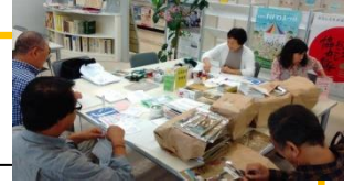
講演会準備作業の様子

市民活動支援補助金は、平成 26 年度に始まった市民活動を応援するための、逗子市による補助金です。市民団体の公益的・社会貢献的な活動に対し、ステップ 1 (団体の立ち上げ費用として上限 5 万円) 又はステップ 2 (事業を充実させる費用として上限 20 万円) の補助金が交付されます。