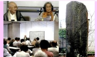
【講演会の様子と三浦胤義遺孤の碑】

※補助金制度の詳細は市ホームページからもご覧いただけます。 http://www.city.zushi.kanagawa.jp/syokan/simin/hojokin/