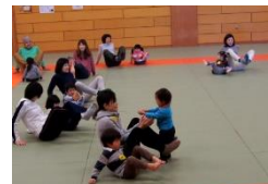
逗子まちのこ保育 プロジェクト