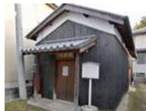
現存する固寧倉(2012)