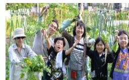
←ダイコン収穫! 子どもたちと行う農作業。カフェOpen目指しています!