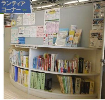
ボランティア コーナー