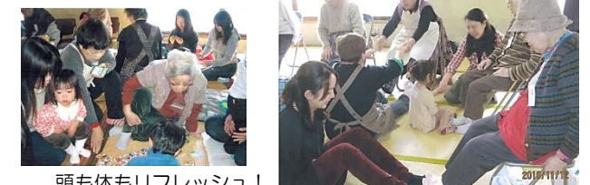
頭も体もリフレッシュ!