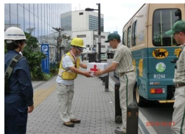
支援物資到着！災害時もヤマト便で届けられます！