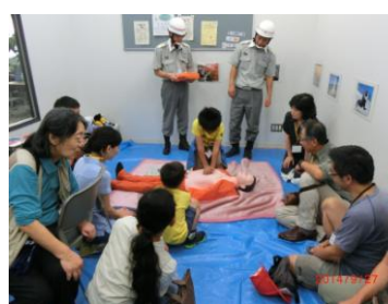
AED訓練に子どもたちも積極的に参加

9月27日(土)、市民交流センター、逗子小体育館で行われた総合防災訓練・避難所運営訓練の様子です。楽しく学びながら、あらためて避難所の大切さを感じた一日でした。毎年実施しています。まだ一度も参加していない方は、ぜひ来年どうぞ！