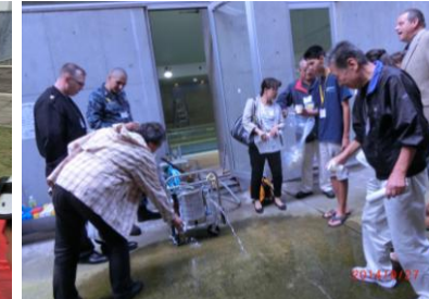
緊急用浄水装置で、プールの水も飲めました！