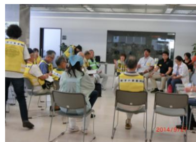
8:40 避難所開設会議。いよいよ訓練開始です！