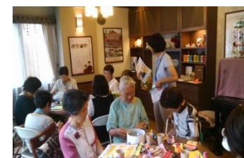
包括支援センターからの話