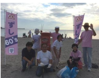
ゴミを集めてビーチクリーン

逗子駅と新逗子駅の前で新ルールのカードと海の家チラシを海水浴客に配り、海岸では毎週土・日曜日にゴミを集め、若い方々や子ども達向けのゲーム、健康に良い朝ヨガを行いました。お客様にはとても喜んでいただけたと信じています。