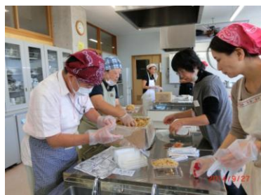
熱湯や冷水を注入すると、ご飯になるアルファ米も準備完了♪

9月27日(土)、市民交流センター、逗子小体育館で行われた総合防災訓練・避難所運営訓練の様子です。楽しく学びながら、あらためて避難所の大切さを感じた一日でした。毎年実施しています。まだ一度も参加していない方は、ぜひ来年どうぞ！