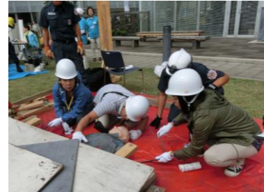
ジャッキ訓練は、3人で力を合わせて！・・・真剣です！