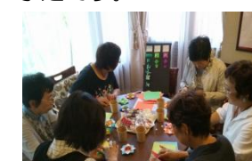
折り紙作りに真剣！

折り紙で独楽を作ったり、千代紙や和紙で箸袋を作ったり、11月10日(月)はミニクリスマスツリーを作る予定です。