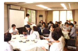
講習会の様子です