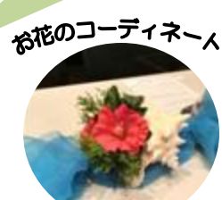
お花のコーディネーター