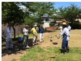
7月12日:田越川一斉清掃の様子 8月3日:会員向け講習会風景