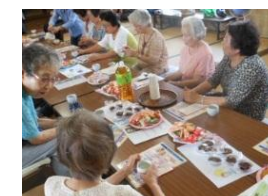
6月は総勢22名が参加

前回6月のサロンは、初めて屋内で開催。お菓子とお茶でお迎えし、下桜山サポーター全員がみなさんとひとつの輪に入って談笑しました。また、包括支援センターや警察からの「非常時に備えるバッグの中身」「振り込め詐欺」についてのお話も聞きました。帰りには、みなさん笑顔になり、「またよろしくね。楽しかった」と声をかけていただきました。みなさんもぜひ、お越しください!