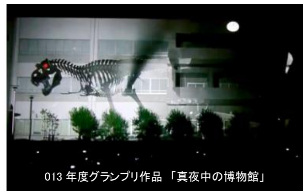
013年度グランプリ作品「真夜中の博物館」