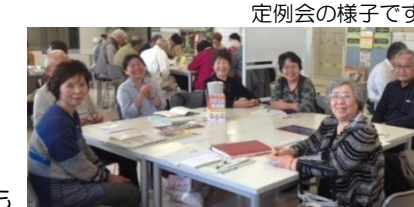
定例会の様子です