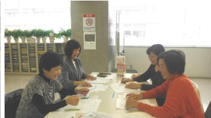
筆記通訳サークル「なみ」

年3～4回の美術展のため、月一回理事会、随時事務局会議で使用させていただいています。