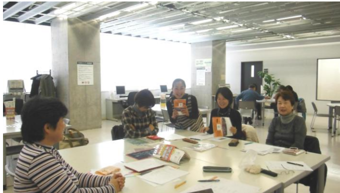
第8回子どもフェスティバル実行委員会

予約なしで夜間も使用できる、開放的な空間のため、次々にアイデアが湧いてきます(^o^)