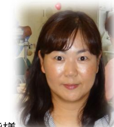
お世話になりました!

開設日・時間:月曜日~金曜日 9時~17時 (交流センター休館日・祝日は除く) 連絡先: 電話 046-873-8037 FAX 046-872-2519 Eメール vc@zushi-shakyo.com