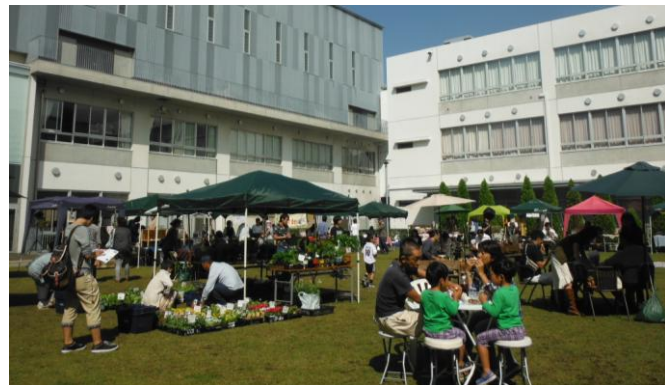
さまざまなアーティストが表現する、実験的音空間プロジェクト♪ 多くの来場者で大賑わい♪