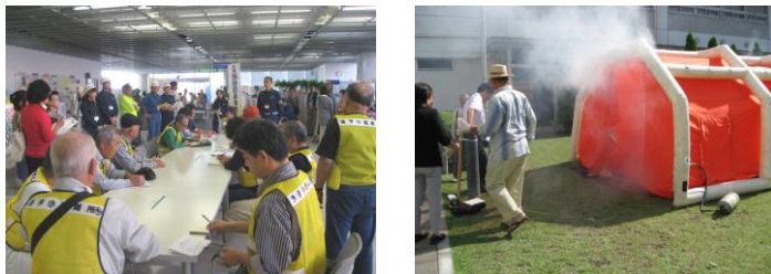
開始です！ 気を引き締めて… フェスティバルパークで、煙体験

災害への備えて大切なのは、日常と違う災害時の行動を実際に体験し慣れておくことです。避難所運営訓練は毎年行っています。いざという時の的確な判断と行動のために、ぜひ参加してみてください。