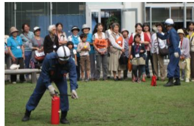
消火器訓練にも、たくさんの参加者