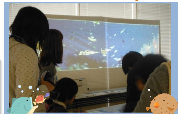
紙に描いた絵がデジタル化され、映像の中に現れ、ディスプレイの上で動きだします