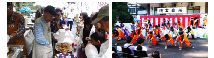
大人気の屋台ブース 踊りは「被災地にとどけ隊」

屋台ブースの皆さんは、普段の活動とは違ったボランティアに試行錯誤しながらも、楽しそうに活動されていたのが、とても印象的でした。