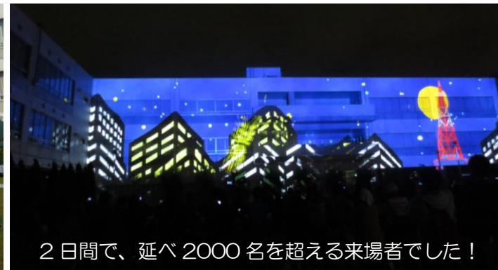
2日間で、延べ2000名を超える来場者でした!