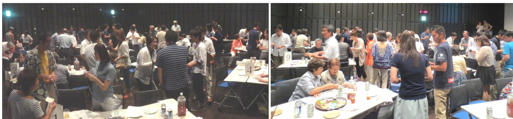
↑最後のふれあい名刺交換では、「時間も名刺の数も足りない」という声が...うれしい反省点です。