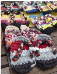
布草履 1足 ¥1500

逗子市社協では「続けよう被災地支援!」をスローガンに、様々な被災地支援を行っておりますが、宮城県女川町支援として、今まで計2回ボランティアバスツアーを実施しました。仮設住宅にお住まいのお母さん方が作っている、この夏にぴったりの「布草履」の販売を7月から福祉会館で始めました!