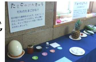
たまごの研究、たねの研究、血の研究など13の研究テーマが！