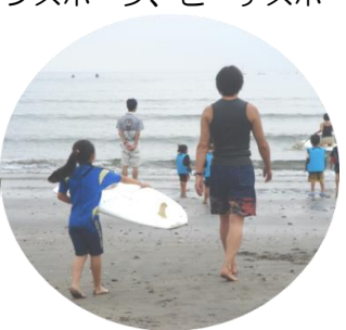
やってみようビーチスポーツの指導をしっかり受けて、いざ出陣！