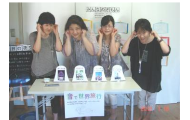
1Fホールのおもしろコーナー 大人も楽しめます♪