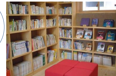
科学読みものライブラリー 科学に関する本が2000冊