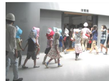
落ち着いて避難訓練に取り組み子どもたちに感心の声しきり。

7月3日、文化プラザホール、図書館、逗子小学校、市民交流センターの4施設で合同防災訓練を実施しました。