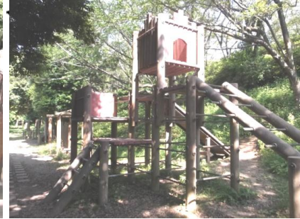
トイレ・駐車場あり