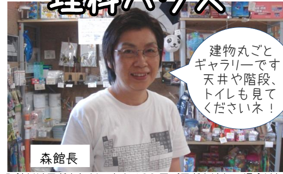
森館長 入館料は子ども無料、大人100円（子ども連れの場合は無料）