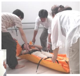
↑担架や車イスで人を運ぶ訓練