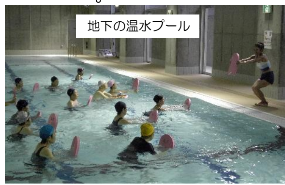
水泳教室も盛ん。歩行コースも人気です。