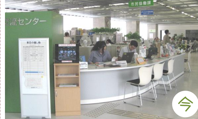
2009年に市民協働課を配置。翌年にはボランティアセンターの相談窓口がオープンしました。