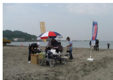
ハーフマイルビーチを歩く会 （逗子海岸）