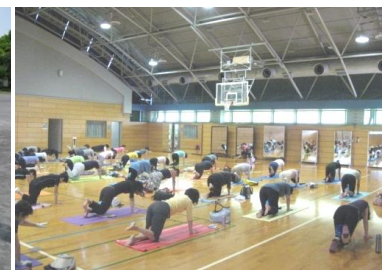
ヨガ （逗子アリーナサブアリーナ）