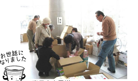
東日本大震災の救援物資受け入れも行いました。