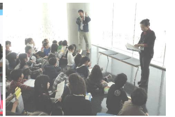
毎年市内の小学生が見学に来てくれます。