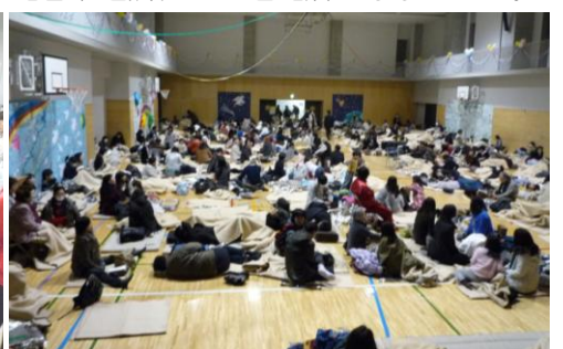
不安な一夜でした。