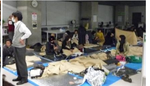
不安な一夜でした。