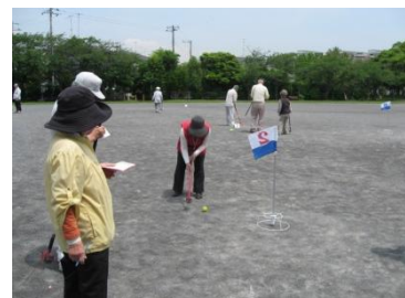
グラウンド・ゴルフ （第一運動公園自由運動広場）