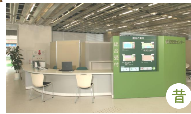
2007年7月逗子市民交流センターオープン