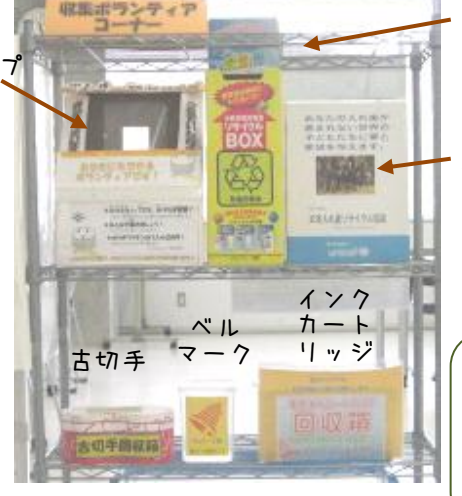
2009年に設置しました。