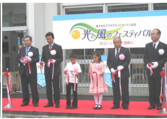
2009年逗子文化プラザグランドオープン