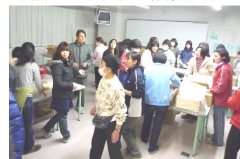
逗子小地区避難所運営会の皆さん