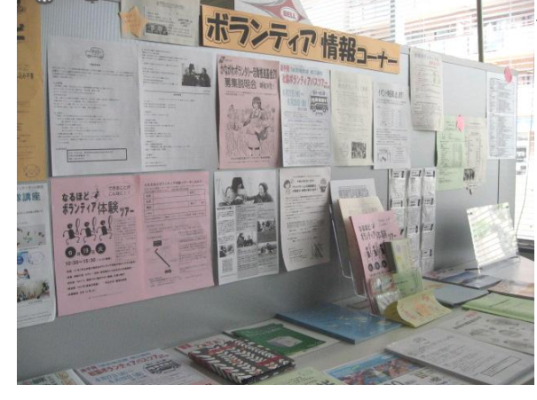
ボランティアに関する情報が満載です♪