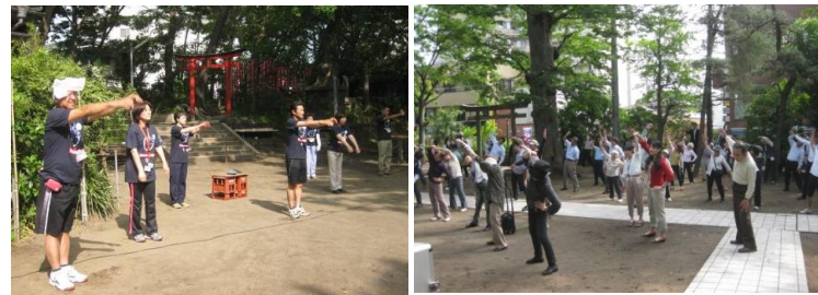
市長とラジオ体操（亀ヶ岡神社）

鳴門市の勝利です。おめでとうございます。今回初参戦の逗子市は、参戦3回目の鳴門市に及びませんでした。が、参加報告をしてくれた市民からは、「思ったより高い参加率だった」「気になっていたスポーツに参加できてよかった」「いつもやっていたことだから」と、勝敗に関係なく楽しめた様子が伝わりました。