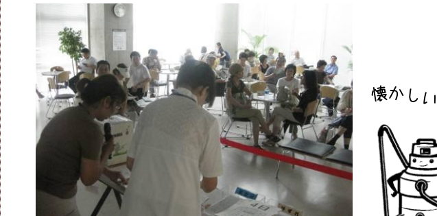
2011年11月まで行っていた抽選会