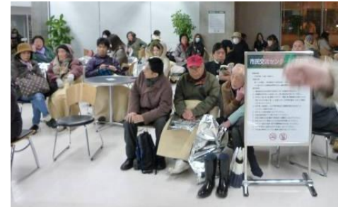
交流センター、逗子小体育館は帰宅困難者や近隣住人の避難所になりました。