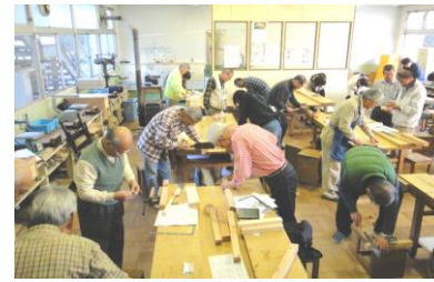
DIYパワー技術講座(木工編)

市民グループが活動の経験を活かして開講する講座。昨年度は、「DIYパワー技術講座(木工編)」「DIYパワーの会」と、「お花のマナー・養成講座」(ソーシャル フラワー アカデミー)を実施しました。