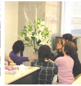
お花のマナー・養成講座