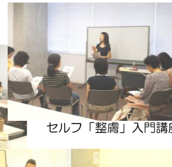
セルフ「整膚」入門講座、