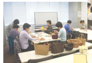
↑クラフト紙テープでカゴ作り