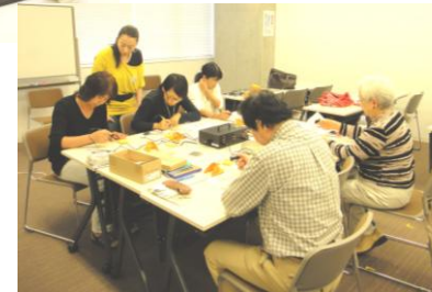
ウッドバーニング