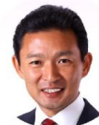
逗子市長 平井竜一