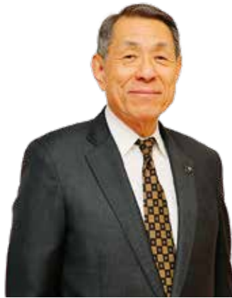
逗子市長 桐ヶ谷 寛