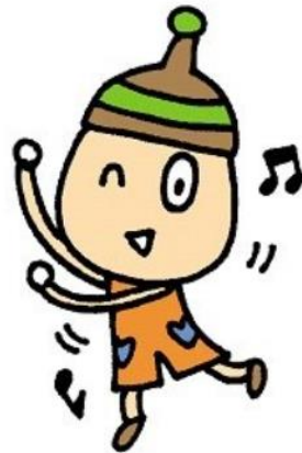
逗子市広報キャラクター シズオ