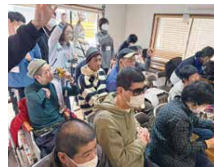
年1回のバス旅行とお楽しみ会は、本人たちも楽しみにしている一大イベント。大勢の仲間で過ごす、貴重な機会

来年も、4月になぎさホールで発表会を予定しています。彼らの演奏を、ぜひ聴きにいらしてください。