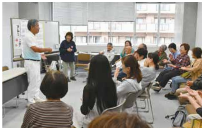
勉強会では、テーマに沿った内容の手話をそれぞれが披露する。積極的な意見交換に加え、笑いを交えながら楽しく手話を学ぶ

手話が未経験でも大丈夫。興味があれば、ぜひ見学に来てください。来年は創立40周年。私たちの活動が、ろう者と健聴者の交流を広げる力になればと願っています。