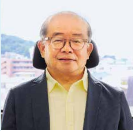
(一財)すこやかさゆたかしの未来研究所 代表理事