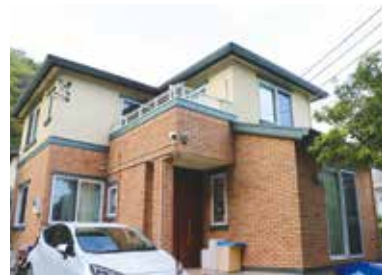
(上)職員が見守る中、好きなように過ごせるリビング (下)取材した「ジャストサイズ新水科(久木)」。1棟6LDKに6人が暮らす