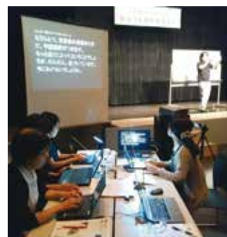
話の内容をその場でパソコン入力し、モニターに文字情報として表示する