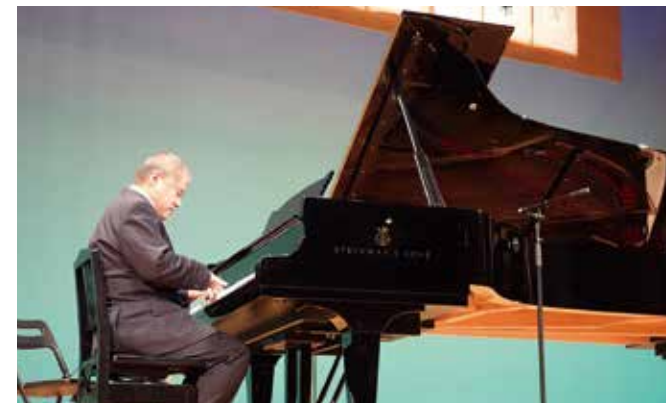
38回目となる今年の発表会には約30人が参加。中には1回目から参加している人も。それぞれの弾き方で、舞台での演奏を楽しむ