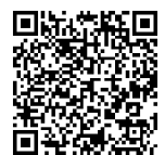
フォーム QR コード