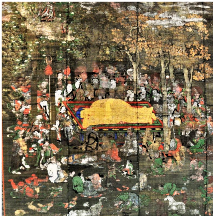
対象物件の写真（部分）

なお、本図の経歴については、天正11年（1583）に毛利氏領国の某所に寄付されたこと、天保11年（1840）に再補されたこと、昭和8年（1933）まで広島県鞆町地藏院に収蔵されていたことが巻止貼付紙や箱書からわかる。