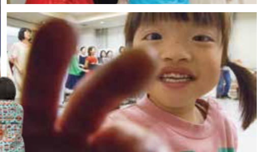
上の写真は全て、逗子を拠点に活動するゴスペルグループ「AKchoir (エーケークワイア)」を招き昨年12月に開催したミニコンサートの様子