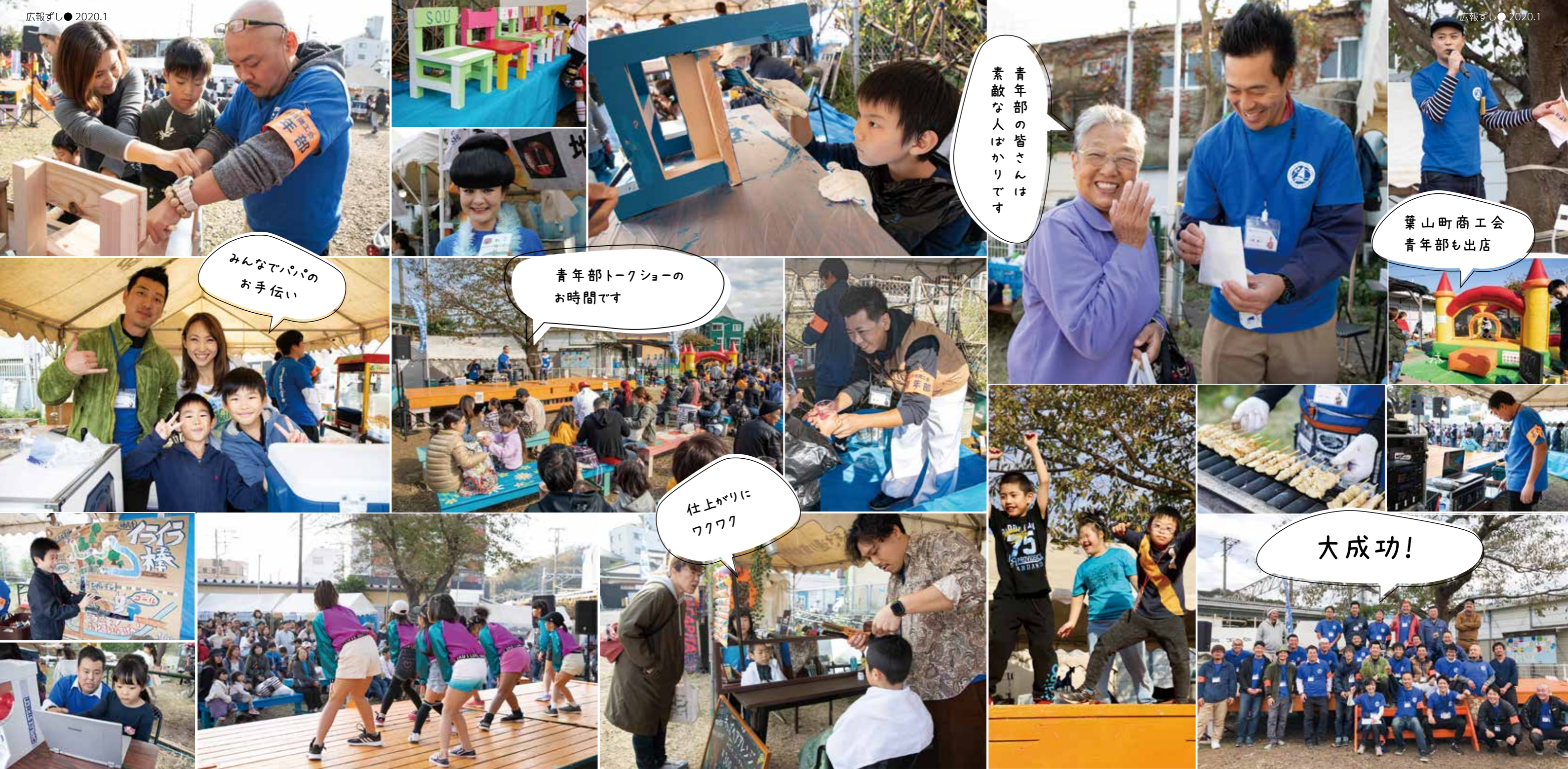
みんなでパパのお手伝い