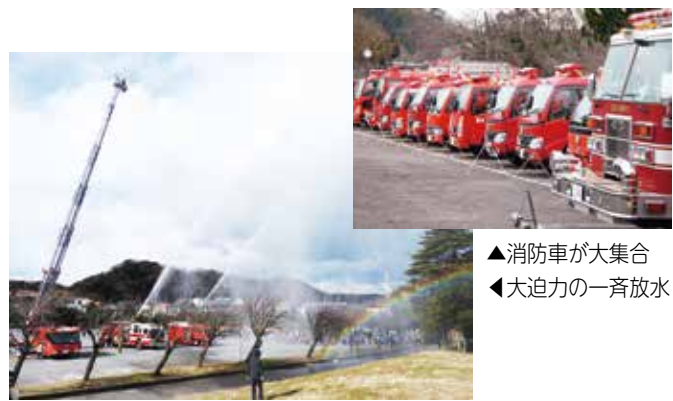
▲消防車が大集合 ▲大迫力の一斉放水

長年にわたり消防業務に貢献した人の表彰、逗子開成高等学校和太鼓部・逗子高等学校吹奏楽部による演奏、消防団による消防操法、消防署・消防団・米海軍池子消防隊による一斉放水など 時 1月11日(出)10:00～ *雨天中止。 場 第一運動公園自由運動広場 問 消防総務課