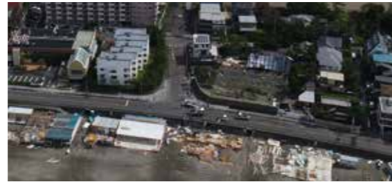
▲台風15号通過後の逗子海岸