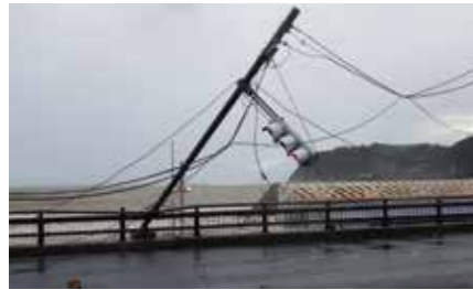
▲台風15号により倒れた国道134号の信号

時 1月20日(月)～24日(金)8:30～17:00 *24日は16:30まで。 場 市役所1階市民ホール 問 防災安全課