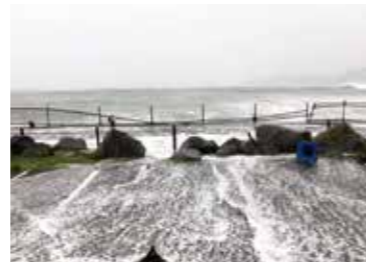
▲台風19号により壊れた小坪飯島公園のフェンス