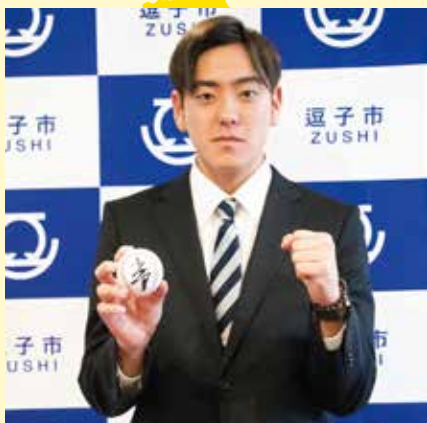
阪神タイガース 投手

身の回りの人々や地域の環境、そして自分自身を信じ認めて前向きに生きる市民に、このまちで生きる意味を聞きました。