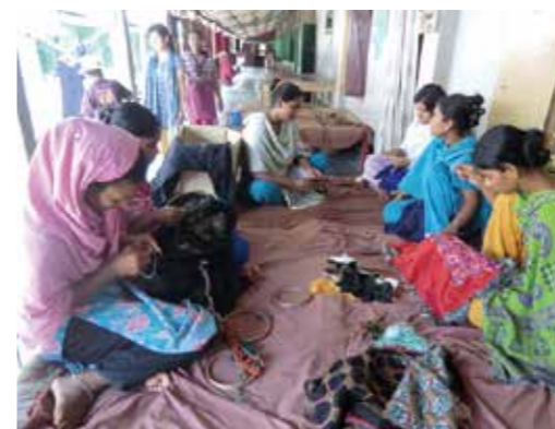
刺しゅうをする若い女性たち