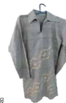
スワローズの販売所の服

設立当初、働く場を求めてやって来た女性たちは「ここで働くことができたから、生き延びて子どもたちを育てることができた」と語り、今でもベテランの職人として働いています。また、子どもを安全に預け、教育を受けさせる環境が整っているため、多くの若い母親たちも働いています。