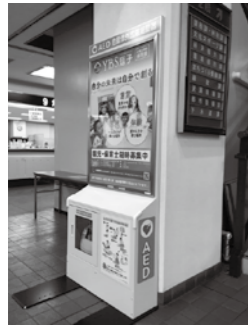
制度を利用して市役所1階に設置したAED(上)と案内板(右)