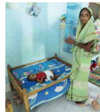
乳児を世話する保育担当の女性