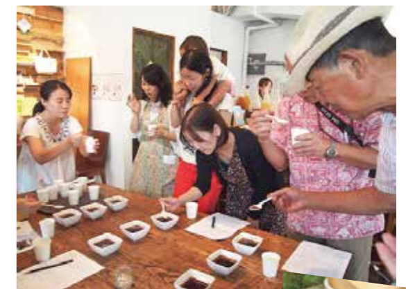
逗子珈琲開発の様子