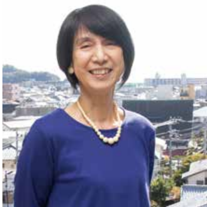
逗子フェアトレードタウンの会 会員