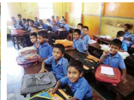
スワローズの小学校で勉強する子どもたち