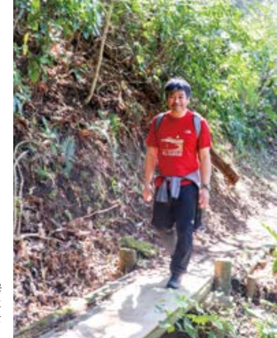
逗子海岸から第2号墳まで登りきると約100mの標高を登ったことになる

また、下半身の運動は美肌に効果があるという研究もあります。下半身の筋肉から分泌されるマイオネクチンというホルモンは、血流に乗って顔まで運ばれます。このホルモンにはメラニンの生成を抑える働き