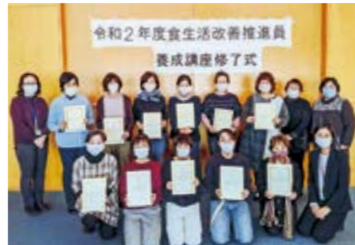
修了後はヘルスマイトとして地域で食のボランティア活動ができる