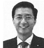
党副委員長 山下 よしき 現 59歳。参院議員3期。 活動地域 大阪、兵庫、滋賀、奈良、和歌山