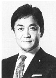
国民民主党 代表 山本太郎