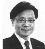
党参院幹事長・国対委員長 井上 さとし 現 61歳。参院議員3期。 活動地域 北海道、北陸、福井、京都