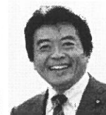
弁護士 仁比 そうへい 現 55歳。参院議員2期。党参院国対委員長。 活動地域 中国、四国、九州、沖縄