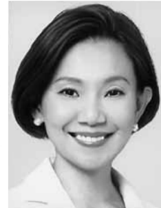
みんなの党・公認