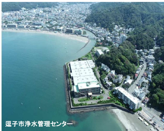
逗子市浄水管理センター

逗子市では、老朽化した下水処理場を地震・津波対策を備えた強靱な施設として再整備する計画を進めています。市内唯一の下水処理場が市民の生活を守るとともに、海や川の水質を保全するために技術の粋を結集して取組む職員を求めており、今回は機械職を募集します。