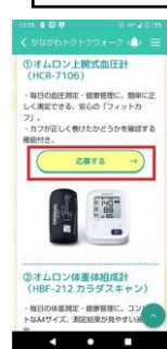
④希望する賞品の「応募する」をタップ