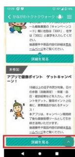
③逗子市 アプリで健康ポイント ゲットキャンペーン！の「詳細を見る」をタップ