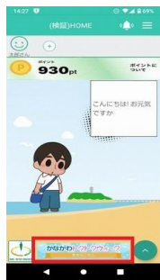
②アプリトップページ下部「かながわトクトクウォーク」をタップ