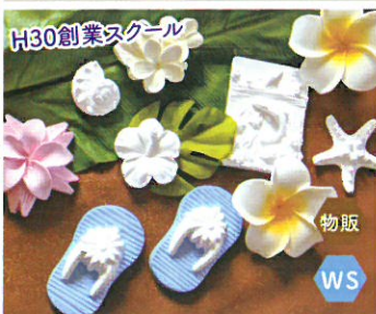
Nature Living アロマストーン ハーバリウム アロマ香水作り