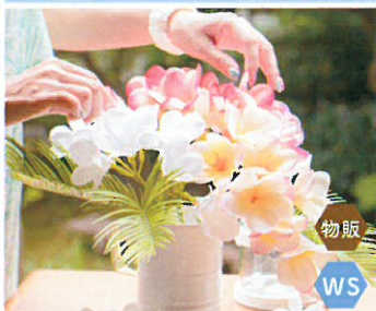
Lamer fleur クリアジェルキャンドル 小さなお子様から楽しめる グラスサンドアート