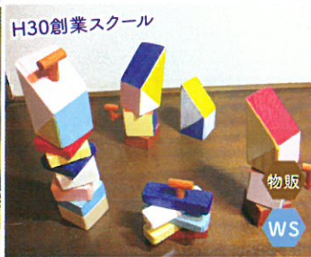
WOOD COMMUNICATIONS チャイルドチェア ブロックカレンダー ミニカレンダー立て作り