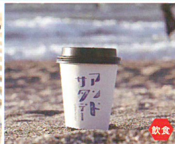
アンドサタデー 珈琲と編集と コーヒー/カフェラテ オリジナルグッズ