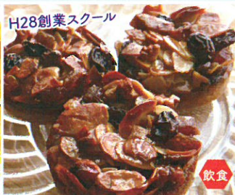
H28創業スクール BAKE IT! 焼菓子