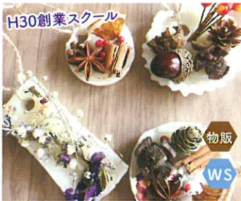
Retreat aroma labo アロマハンドマッサージ アロマワックスバー