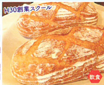
H30創業スクール ナチュラルブレッド 亀亀堂 パン、焼菓子等