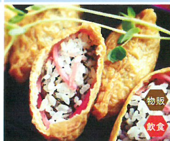
NPO法人 地域魅力 新宿稲荷 逗子地元の人Tシャツ