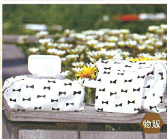
kururi おむつポーチ/スタイ 抱っこひもカバー ハンカチ/アクセサリ