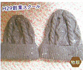
ひなたぼっこ 手編み帽子・小物