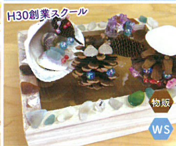
ワクワクの芽 フォトフレーム ハンドメイドアクセサリ 小物入れづくり