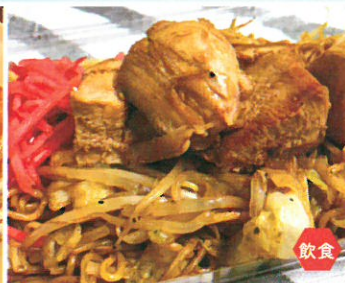
合同会社 Loco beach 逗子サーファーのための 湘南お肉ゴロゴロ焼きそば