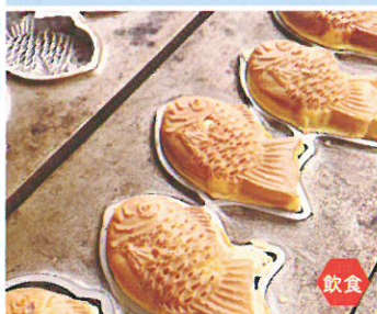
とうふ工房とちぎや お豆腐屋さんの豆乳を たっぷり使った「豆乳たい焼き」 「油揚げとがんものせいろ蒸し」