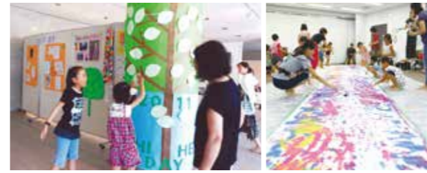
市民と市が協働で、2011(平成23)年からずし平和デー、2013(平成25)年から逗子アートフェスティバルを開催