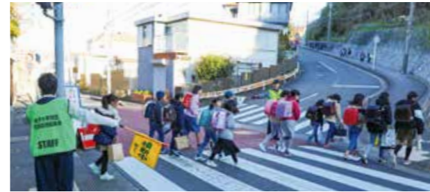
地域の課題に対応する、新しい地域自治の仕組みとして、2015(平成27)年から住民自治協議会が始まった