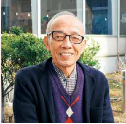
長柄桜山古墳をまもる会 会長

身の回りの人々や地域の環境、そして自分自身を信じ認めて前向きに生きる市民に、このまちで生きる意味を聞きました。