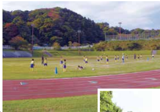
2015(平成27)年に池子の森自然公園スポーツエリア、翌年には緑地エリアがオープン

海と山、豊かな自然に囲まれた逗子。都市部へ近い立地から、たくさんの移住者を受け入れ住みやすいまちへと発展してきました。70年という歴史の中では自然災害や、近年では感染症の流行などもありました。けれど、いつの時代もまちには生き生きとした市民の姿があり、変化や困難も柔軟な姿勢で乗り越えてきました。これまでも、そしてこれからも。希望があふれる明るい未来に向けて、歩み続けていきます。