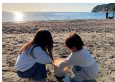
逗子海岸の砂浜で遊ぶことも。「海沿いのドライブも楽しい」と話す

子どもが大きくなったら一緒にマリンスポーツやハイキングに挑戦してみたいし、親子イベントなどにもどんどん参加したいです。豊かな自然の中で、これからも家族で逗子暮らしを楽しみたいと思っています。