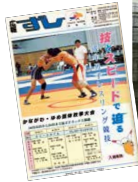
1997(平成9)年に逗子アリーナがオープン。翌年のかながわ・ゆめ国体のレスリング会場に