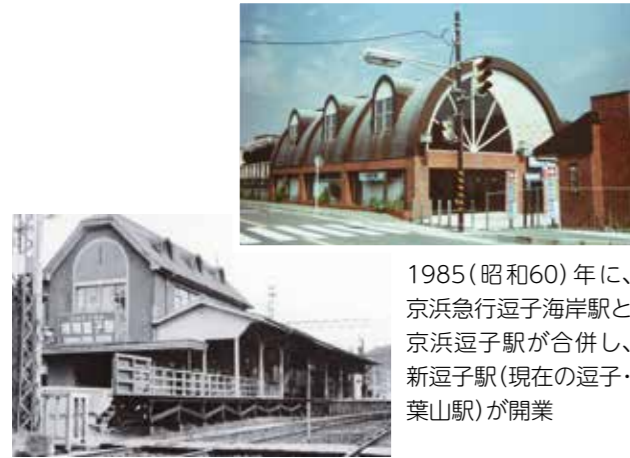
1985(昭和60)年に、京浜急行逗子海岸駅と京浜逗子駅が合併し、新逗子駅(現在の逗子・葉山駅)が開業

1995(平成7)年にJR逗子駅前広場の整備が完了。歩道を広く段差もなくして、点字ブロックやベンチを配置した