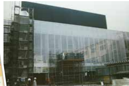
2005(平成17)年に現在の図書館と文化プラザホール、2年後には市民交流センターと、幅広い世代が集える施設がオープン