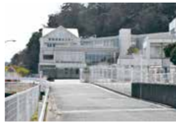
2001(平成13)年に逗葉地域医療センター・保健センターが完成。日米共同使用だった進入路は、2022(令和4)年に市に返還