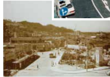
約60年前、1963(昭和38)年頃の駅前広場

1995(平成7)年にJR逗子駅前広場の整備が完了。歩道を広く段差もなくして、点字ブロックやベンチを配置した