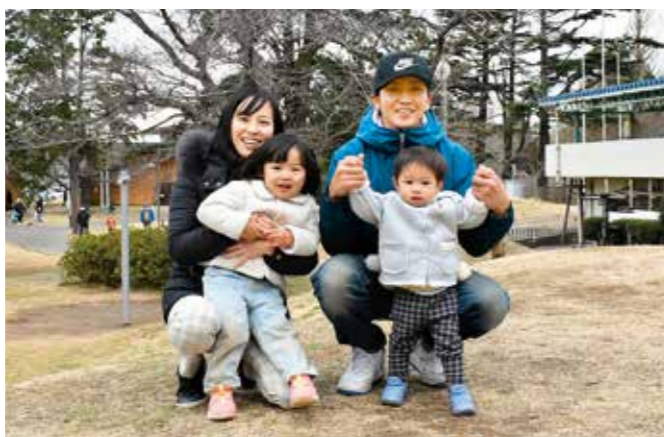
池子ほっとスペースもあって、子育て世代にとっても有り難いです