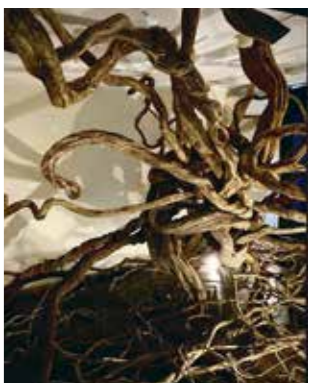
昨年の逗子アートフェスティバルの作品「鼓動」

イベント会場などの装花を手掛けるほか、コンテストや展覧会などにも出展。2022年のいけばな大賞では、文部科学大臣賞を受賞