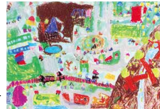
小学校2年生の時、市制40周年記念「逗子・夢の未来図」に応募。優秀賞を受賞した

昨年の逗子アートフェスティバルでは、逗子の山のフジづるを使った作品を展示。枝や幹に絡んで木を傷めるフジづるは、手入れが行き届かない山の厄介者と言われています。身近な環境問題にも目を向けて