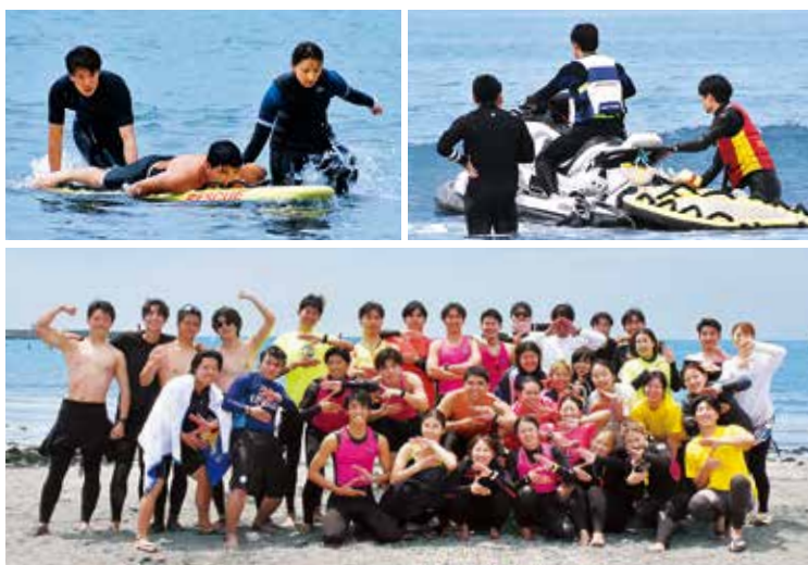
一年を通じて救助練習に励み、海水浴期間中の監視活動に備える逗子サーフライフセービングクラブ