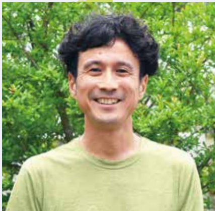
逗子SDGs絵日記実行委員会 代表

身の回りの人々や地域の環境、そして自分自身を信じ認めて前向きに生きる市民に、このまちで生きる意味を聞きました。