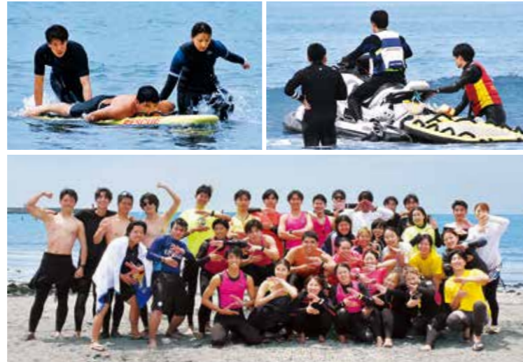
一年を通じて救助練習に励み、海水浴期間中の監視活動に備える逗子サーフライフセービングクラブ