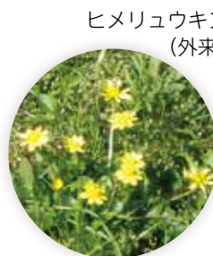
ヒメリュウキンカ (外来種)

砂がたまった場所には、春先に黄色の花を咲かせるヒメリュウキンカや紫色の花のショカツサイなどの外来種が。一方、在来種のヨシやヒメガマ、逗子では珍しいサンカクイなど、水辺らしい植物も観察されます。