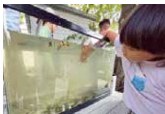
年2回、まちなみと緑の創造部会による「さかな観察会」では、さまざまな生きものを目の前で観察できる

感じることがあります。例えば、ハグロトンボの幼虫(ヤゴ)。生きものの種類が変わるのは、川を巡る環境が変わってきていることが原因かもしれません。昆虫が少なくなると、その昆虫を餌にする魚、それらを餌にする鳥にも影響が。生きもの多様性は、そうしたつながりの中でバランスが保たれていると言われています。