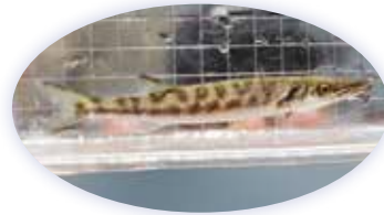
オニカマスの幼魚