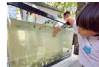
年2回、まちなみと緑の創造部会による「さかな観察会」では、さまざまな生きものを目の前で観察できる

田越川は勾配が緩やかで、河口は広く海に面しているため海水魚も多く生息します。春には、河口から離れた上流でボラの群れが見られることも。また、川の魚を狙う鳥や植物を食べる鳥も川にはやってきます。一方、以前はよく見た生きものを最近は見ないと