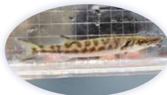
オニカマスの幼魚