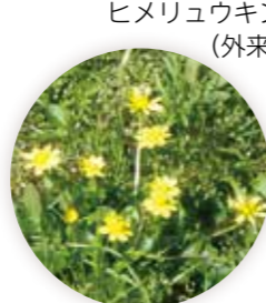
ヒメリュウキンカ (外来種)

砂がたまった場所には、春先に黄色の花を咲かせるヒメリュウキンカや紫色の花のショカツサイなどの外来種が。一方、在来種のヨシやヒメガマ、逗子では珍しいサンカクイなど、水辺らしい植物も観察されます。