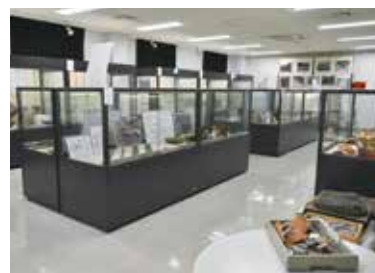
池子遺跡群資料館 (池子の森自然公園内) 時(火)～(日)9:00～16:00 * 休み(月)(祝日の場合は翌日の平日)、年末年始 TEL 046-871-7006 ID 1004553

池子遺跡群資料館では、ここで紹介した出土品に加え、近代までの池子に暮らした人々の生活を示す痕跡を公開しています。