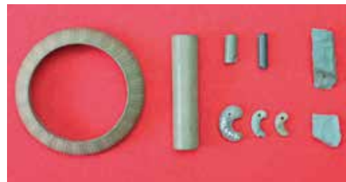
持田遺跡で発掘された石製装身具類。左にある石製の腕輪「石釧」は完全なものとしては県内で唯一

桜山5丁目の台地上にある持田遺跡は、弥生時代中期から平安時代にかけての大規模な集落遺跡です。ここで出土した石製の装身具などは、古墳への副葬や他地域との交流のために使われたとされ、市の重要文化財に指定されています。また、国史跡長柄桜山古墳群は県内でも最大級の古墳で、埴輪や土器などが出土しました。いずれも市域を越えて、広く神奈川や東日本の歴史を考える上で大変貴重な文化財です。