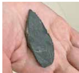
池子遺跡群で発掘された、市内最古のナイフ形石器。片側は鋭い刃で、もう片側は厚みを帯びている

弥生時代以降は海岸線が大きく後退し、現在の逗子の基本的な姿が形作られました。池子遺跡群からは、約2,000年前の弥生時代中頃に使われていた農具や工具など、大量の木製品が発見されています。保存状態が良好で、県の重要文化財に指定されています。