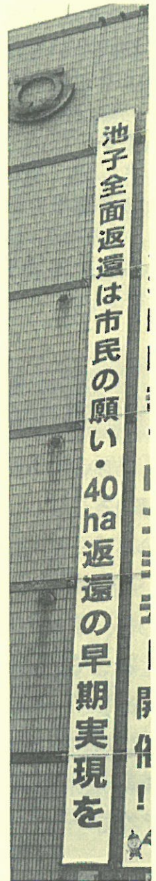
市役所に掲げている懸垂幕