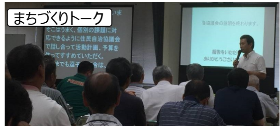
市長と直接意見交換